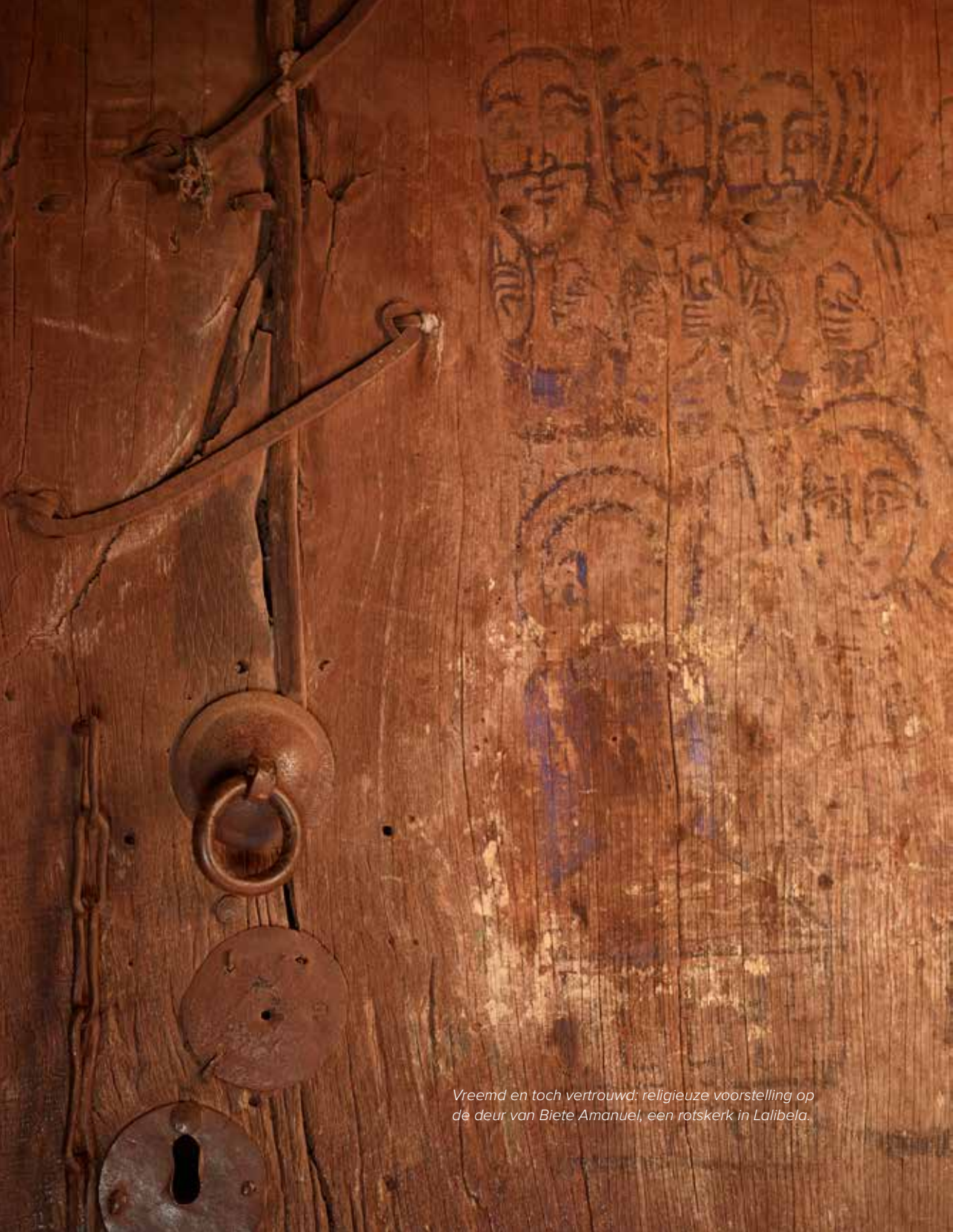
Vreemd en toch vertrouwd: religieuze voorstelling op de deur van Biete Amanuel, een rotskerk in Lalibela.